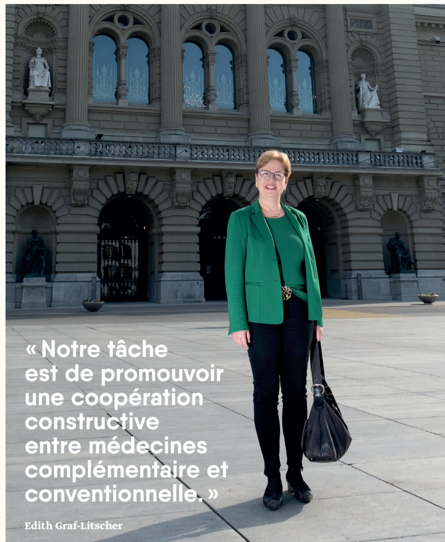
La conseillère nationale Edith Graf-Litscher fournit un précieux travail politique de fond.

La force de la médecine complémentaire réside dans le traitement individuel, adapté à la personne, souligne Edith Graf-Litscher, conseillère nationale et présidente de la Fédération de la médecine complémentaire Fedmedcom. « La preuve de