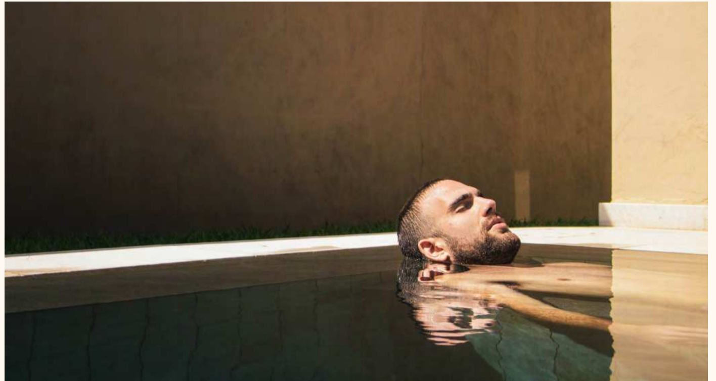
Die gesundheitsfördernde Wirkung von Bädern ist erwiesen.

«Rheuma ist nicht nur eine Alterskrankheit; auch junge Menschen sind betroffen.»